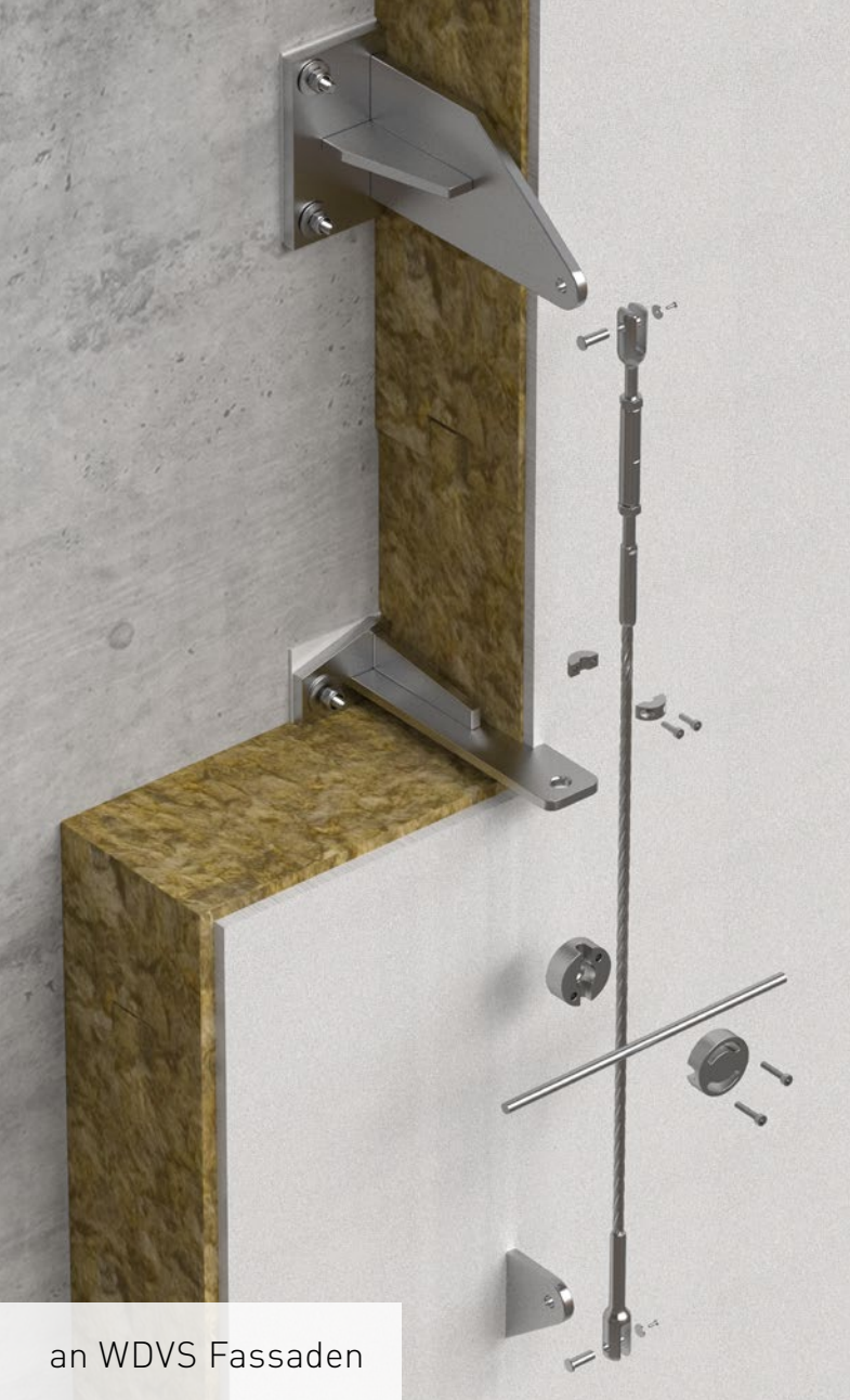
an WDVS Fassaden